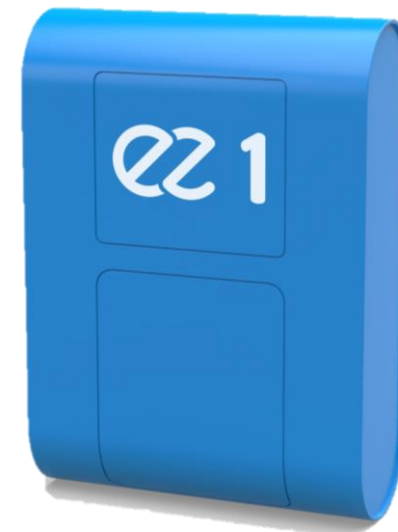
Contrôle et supervision à distance